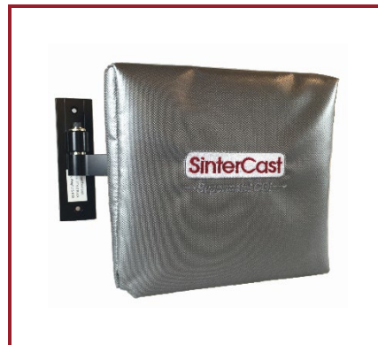
欣特卡斯特跟踪技术