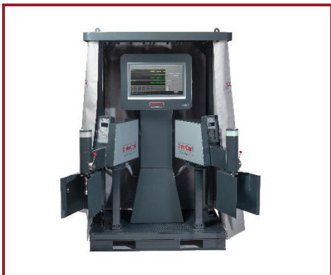
自动化系统 4000 全自动化批量生产

韩国 Hyundai Jeonju (现代全州), 浇包跟踪系统 墨西哥 IronCast (艾尔卡斯塔), 浇包跟踪系统 加拿大 Poitras (普瓦特拉斯), 浇包跟踪系统 瑞典 Scania Classic (斯堪尼亚 传统铸造), 铸件跟踪系统 巴西 Tupy Joinville (图比 茹因维利), 浇包跟踪系统 墨西哥 Tupy Saltillo Line 3 (图比 萨尔提略 3 号线), 铸件跟踪系统 墨西哥 Tupy Saltillo Line 3 (图比 萨尔提略 3 号线), 浇包跟踪系统