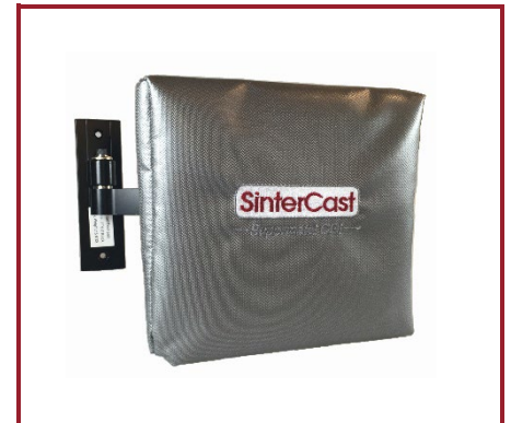
SinterCast Tracking Technologies