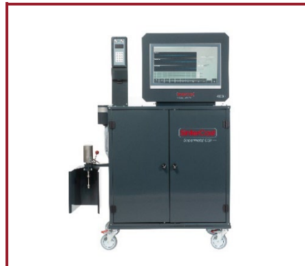
Mini-System 4000 Niche Volume Production, Product Development and R&D