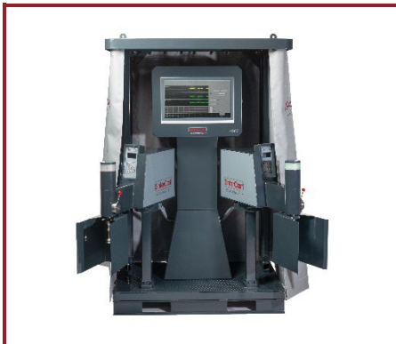
Automated System 4000 Fully Automated Series Production

Poitras, Canada (Ladle Tracker) Scania Classic, Sweden (Cast Tracker) Tupy Joinville, Brazil (Ladle Tracker) Tupy Saltillo Line 3, Mexico (Ladle Tracker) Tupy Saltillo Line 3, Mexico (Cast Tracker) Hyundai, Korea (Ladle Tracker) Teksid Monclova, Mexico (Ladle Tracker)