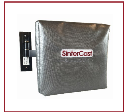
欣特卡斯特跟踪技术