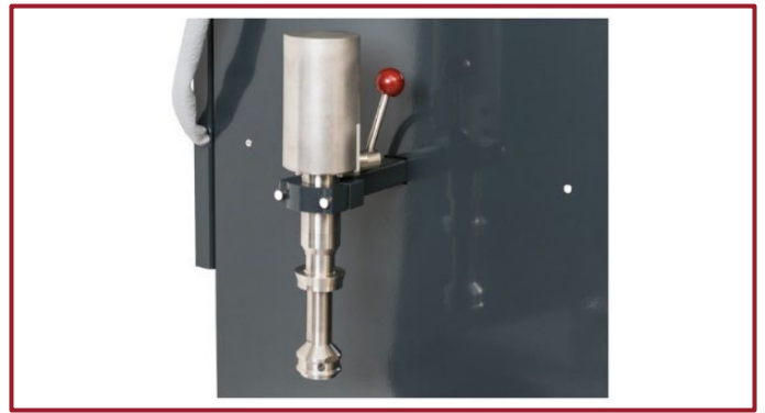
图 3: 重新设计了的取样模块 SAM 和改进了的热电偶支架