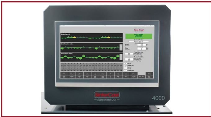
图 2: 操作员控制模块 OCM 更大的图形化显示, 用户友好的操作人员交互界面