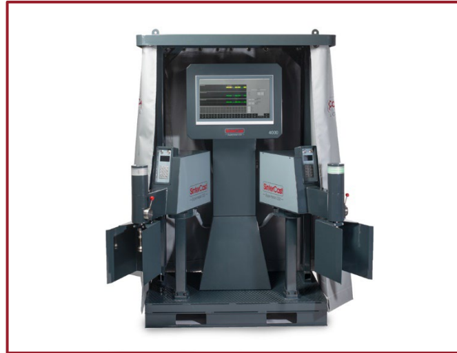
图 1：带有两个取样模块 SAM 的大型自动系统 4000

全新升级的全自动系统 4000 提供了灵活、坚固、准确的硬件和软件平台，使欣特卡斯特客户能够独立控制蠕铁 CGI 系列产品的生产和开发。该系统 4000 由独立的硬件模块组成，可以配置为适合任何铸造厂的布局、工艺流程和产量，包括浇铸包生产和浇注炉生产。基本配置包括一个取样模块（SAM）、一个操作员控制模块（OCM）、一个电源和一个用于在浇铸前自动添加镁和孕育线的通过联网连接的喂线机。这种配置提供了大约每小时 15 个浇铸包的取样能力。可以添加额外的取样模块来增加处理量，进一步提高生产效率。系统 4000 增强型还包括自动反馈控制的前处理过程。