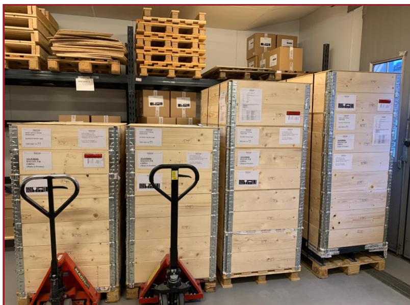
Klart för leverans! System 4000 Plus till First Automobile Works (FAW) levererades från SinterCast Technical Center i Sverige den 29 januari 2020. Efter förseningar orsakade av Covid-restriktioner installerades systemet framgångsrikt på FAW-gjuteriet i Changchun, Kina under hösten 2020.

Styrelsen har beslutat att SinterCast ska följa svensk kod för bolagsstyrning och presenterar en bolagsstyrningsrapport i enlighet med koden inklusive styrelsens rapport om intern kontroll avseende den finansiella rapporteringen. Bolagsstyrningsrapporten innehåller inga större avvikelser från bolagsstyrningskoden, eftersom SinterCasts rutiner ska vara i enlighet med koden.