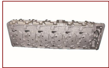
13.0 리터 SinterCast-CGI 헤드

[2017년 4월 19일 스톡홀름 및 상하이] – Jiangling Motors Corporation, Ltd 의 계열사인 JMC Heavy Duty Vehicle Co., Ltd 는 오늘, 2017년 상하이 국제 자동차 전시회에서 중국 국내 시장을 위한 새로운 중장비 상업용 차량을 발표 하였습니다. 9.0 리터 및 13.0 리터 엔진 옵션을 갖춘, 이 새로운 트럭은 Ford 의 유럽 차량 및 엔진 기술을 중국 JMC 에서 현지생산 및 유통 네트워크를 함께 활용한, JMC-Ford 합작 투자의 결과물입니다.