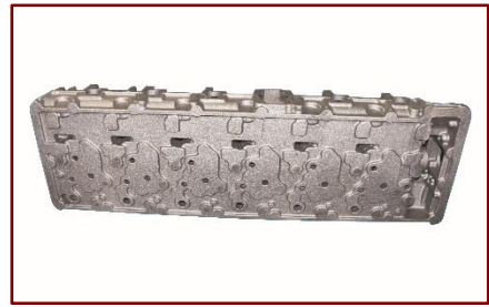
13.0 升欣特卡斯特气缸盖

[2017 年 4 月 19 日，斯德哥尔摩和上海] -江铃汽车股份有限公司旗下的江铃重型汽车有限公司今天在 2017 年上海国际汽车展览会上向国内市场推出重型商用车。新卡车凭借江铃与福特在中国的合资企业引进的 9.0 升和 13.0 升发动机，利用福特欧洲车辆和发动机技术与江铃的本地制造基地和销售网络，使用欣特卡斯特过程控制技术在我国的亚新科国际铸造（山西）有限公司生产蠕铁铸件，9.0 升发动机缸体和缸盖都采用蠕铁，而 13.0L 发动机缸盖采用蠕铁。新发动机在世界最大的商用车市场上提供最先进的性能，耐久性和燃油经济性，同时符合中国国 5 排放法规。随着上海汽车展览会的销售发布，量产即将开始。